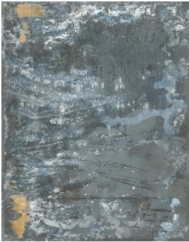
© Dr. Volker Hochdörffer Foto: Petra Wilhelmy