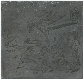
© Dr. Volker Hochdörffer Foto: Petra Wilhelmy