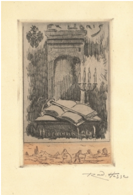
© Dr. Volker Hochdörffer Foto: Petra Wilhelmy