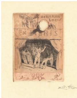
© Dr. Volker Hochdörffer Foto: Petra Wilhelmy