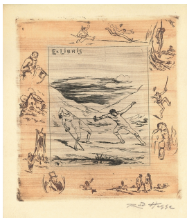
© Dr. Volker Hochdörffer Foto: Petra Wilhelmy