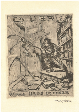
© Dr. Volker Hochdörffer Foto: Petra Wilhelmy