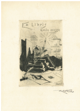
© Dr. Volker Hochdörffer Foto: Petra Wilhelmy