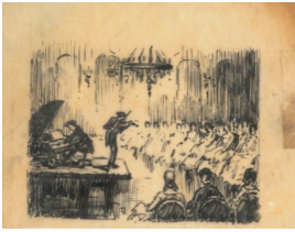
© Dr. Volker Hochdörffer Foto: Petra Wilhelmy