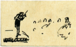
© Kreisstadt Saarlouis Foto: Petra Wilhelmy