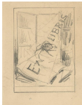
Ex libris Entwurf 1921 Bleistift auf Papier