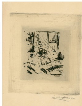
Ex libris 1921 Vernis mou auf Papier