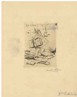
Ex libris Hugo Sanner Radierung auf Papier 1. Probedruck

© Kreisstadt Saarlouis Foto: Petra Wilhelmy