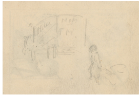
unbenannt [Figur vor Wagen] Bleistift