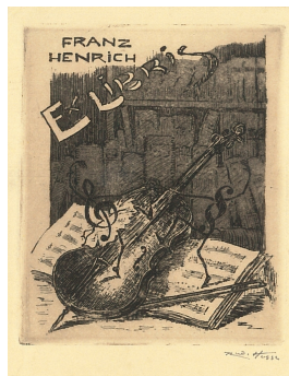
Ex libris Franz Henrich 1932 Vernis mou, Radierung auf Papier

© Dr. Volker Hochdörffer Foto: Petra Wilhelmy