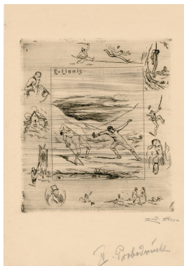
Ex libris Dr. jur. Walter Vogel Radierung auf Papier 2. Probedruck