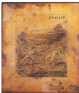
Ex libris Dr. jur. Walter Vogel Druckplatte