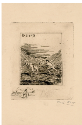
Ex libris Dr. jur. Walter Vogel Radierung auf Papier Variantendruck